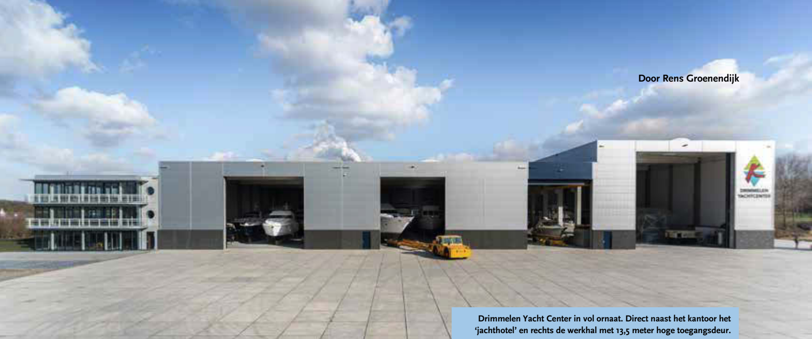
Drimmelen Yacht Center in vol ornaat. Direct naast het kantoor het 'jachthotel' en rechts de werkhal met 13,5 meter hoge toegangsdeur.

De Koninggroep ziet ongekende mogelijkheden met 'jachthotel'