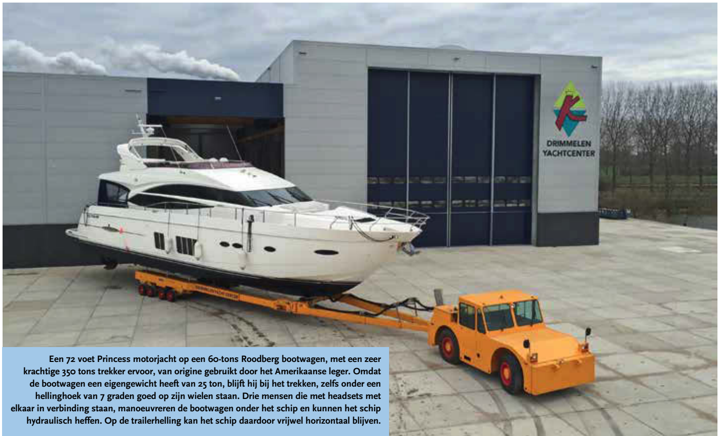
Een 72 voet Princess motorjacht op een 60-tons Roodberg bootwagen, met een zeer krachtige 350 tons trekker ervoor, van origine gebruikt door het Amerikaanse leger. Omdat de bootwagen een eigengewicht heeft van 25 ton, blijft hij bij het trekken, zelfs onder een hellinghoek van 7 graden goed op zijn wielen staan. Drie mensen die met headsets met elkaar in verbinding staan, manoeuvreren de bootwagen onder het schip en kunnen het schip hydraulisch heffen. Op de trailerhelling kan het schip daardoor vrijwel horizontaal blijven.